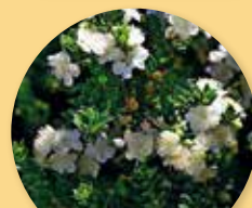
Myrtus communis Tarentina