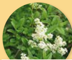
Ligustrum vulgare "Lodense"