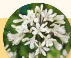
Agapanthus africanus albus