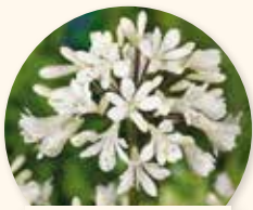
Agapanthus africanus albus