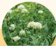
Centranthus ruber "Albus"