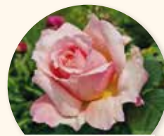
Rosier St Léger

Un Magnolia « Kobus » émerge d'une platebande plantée et crée un signal devant la porte majestueuse.