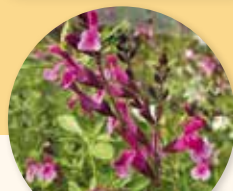
Salvia microphylla 'icing sugar'