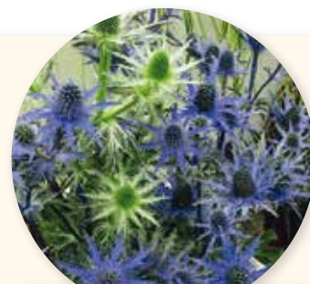
Eryngium zabelii Big blue

De nouvelles essences viennent ainsi compléter les massifs dans des tonalités de bleu ( Eryngium , Agapanthes , Artichaut , Convolvulus ) et blanc ou greige ( Gaura , Agapanthus africanus « Albus » et Pennisetum ) avec des fleurs et des feuillages graphiques et dynamiques.