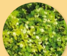
Philadelphus coronarius aureus