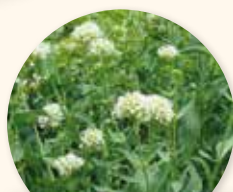
Centranthus ruber "Albus"