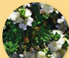
Myrtus communis "Tarentina"