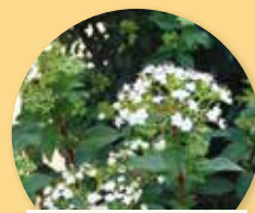
Viburnum tinus "Eve Price"

Des rosiers de Saint Léger rappelant l'origine du nom de cette rue sont disposés devant la porte, en association avec des graminées ( Pennisetum ) et des vivaces ( Gaura ) à même de donner du mouvement à l'ensemble.